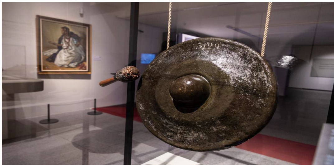
En la imagen, una de las piezas de la Exposición.

El objetivo es difundir el significado e importancia que tuvieron estos instrumentos musicales y el papel que jugaron en las sociedades que los fabricaron, tanto en el ámbito propiamente militar como en lo que significaron en la vida comunitaria de los territorios de ultramar de los que proceden.