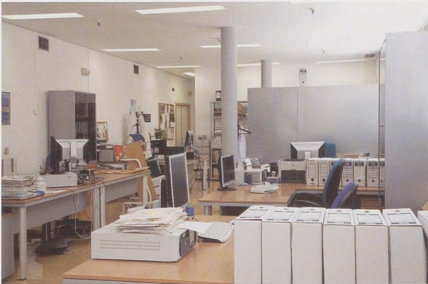
Zona de trabajo (Archivo de la Universidad de Alicante).

entre gestión de documentos (solo los administrativos) y el tratamiento y conservación en los archivos. Esta próxima realidad casa con esa expresión de la que antes os hablaba y con la que no me siento cómoda. La gestión documental será responsabilidad de los gestores documentales y dudo que cuando se refiere a ellos se esté pensando en los archiveros. De aquí, quizá, que algunos previendo la situación han abogado por el cambio de denominación profesional atribuyéndose el nombre de gestores documentales, posición que no había compartido— no sé si equivocadamente— llevada siempre por mi defensa de nuestra identidad. Puede tranquilizar el hecho de que en el art.º 21.1.c que se pronuncia por una coordinación horizontal entre el responsable de la gestión documental y los restantes servicios interesados en materia de archivos, al menos deja una puerta abierta, aunque no responda totalmente a la transversalidad que pretendíamos. A los responsables actuales de la política archivística y a los archiveros no les queda otro camino que despabilar para no perder posiciones.