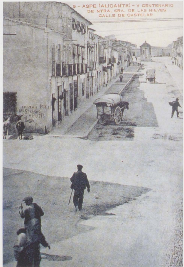
Diario Información de Alicante. Coleccionable: Postales en la historia de la provincia de Alicante [2003].

Serie: Es una categoría documental en la jerarquía del fondo y como tal es un nivel de clasificación. Constituye una sucesión de documentos que testimonian las acciones de una actividad.