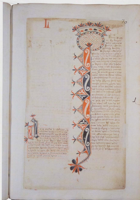
Libro de Privilegios y Provisiones reales. Privilegios de Pedro IV.

Permitidme a este respecto una puntualización. El paralelismo entre «gestión de documentos y gestión de archivos» no me lleva a reconciliarme con la expresión tan frecuente, por generalizada de «Gestión documental y Archivo». En el primer caso hay un paralelismo que exige una ajustada integración, de tal manera que la gestión de documentos no sufre un corte en el momento del ingreso de los documentos en los archivos, ni existe una distinta responsabilidad para la una y para la otra, y la gestión referida a los documentos afecta tanto a los administrativos como a los de conservación permanente que se han venido llamando históricos. En el segundo caso, estamos hablando de dos etapas, una primero, después la otra, con una separación entre las dos a partir de una responsabilidad distinta. Los «gestores documentales» para la primera, los archiveros para la segunda. En este segundo caso la gestión se ciñe a los documentos administrativos.