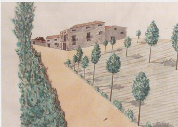
Plano de 1852. Detalle de las posesiones de Joaquín María López.

En cuanto a los archivos, superada la separación entre los administrativos y los históricos, es posible que en un Sistema de Archivos se reduzcan en número sin que la función de archivo se menoscabe. Los recientes textos normativos que desarrollan la Ley 11/2007 de 22 de junio, sobre el acceso electrónico de los ciudadanos a la Administración, reconocen la creación de «repositorios electrónicos» con funciones equivalentes a las de los archivos.