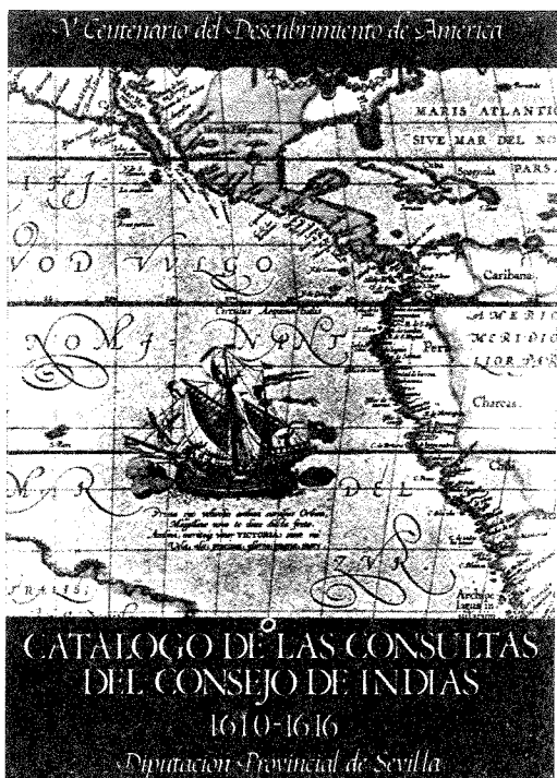
Cover of the third volume of the Catálogo de las Consultas del Consejo de Indias .