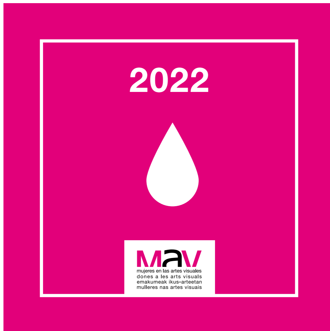
Placa en reconocimiento Una Gota MAV 2022

Un mar que refleje todos los colores del amanecer más hermoso, que nos empuje a mirar hacia el horizonte con esperanza, porque si bien somos conscientes de que la equidad y la igualdad de género todavía tienen un gran camino por recorrer, no podemos olvidar que construir un futuro más igualitario y equitativo está en nuestras manos, puesto que independientemente de lo limitados que sean nuestros recursos o nuestro margen de movimiento, nuestro potencial es y seguirá siendo infinito.