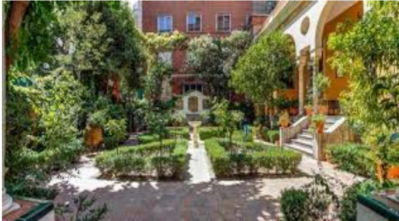
Entrada y jardines del Museo Sorolla de Madrid