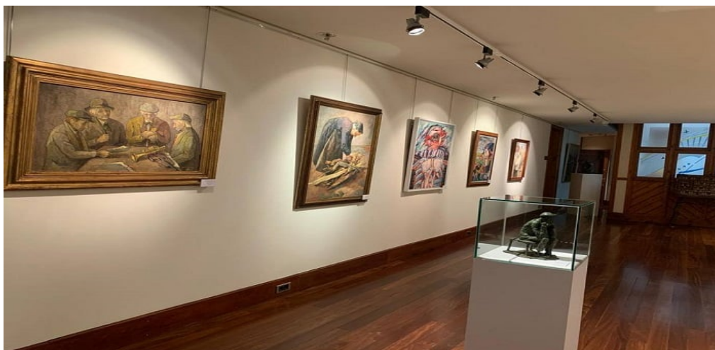
Aspecto de una de las salas de la exposición.

Permanecerá abierta hasta el 15 de septiembre con los siguientes horarios: de 11:00 a 14:00 y de 16:30 a 20:30 los lunes, jueves, viernes, sábados y domingos. Los miércoles es de 16:30 a 20:30 horas.