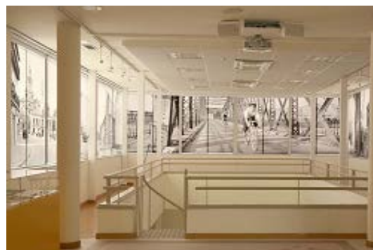
Una vista de la magnífica exposición montada en el Archivo