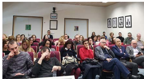
Participantes en la sala