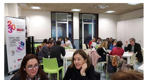
Taller sobre Desarrollo sostenible para Bibliotecas