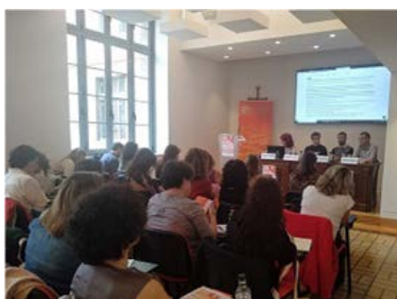
Participantes en la Jornada