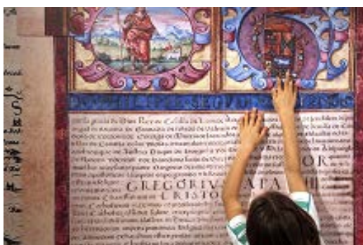
Imagen del cartel de los 30 años del Archivo

Con motivo del aniversario se proyectó un video conmemorativo, hubo visitas guiadas y se presentaron dos publicaciones, un juego de cuatro portafolios con reproducciones de documentos del archivo, y el libro "En testimonio de verdad. 30 años de archivo, 800 años de historia" , con un formato y diseño muy actual y contemporáneo, reflejando la imagen que desea proyectar el servicio de archivo. El título de la publicación hace referencia al signo que los escribanos estampaban al final de las escrituras para validar, junto a la firma y la rúbrica, el carácter de veracidad atribuida a los documentos públicos.