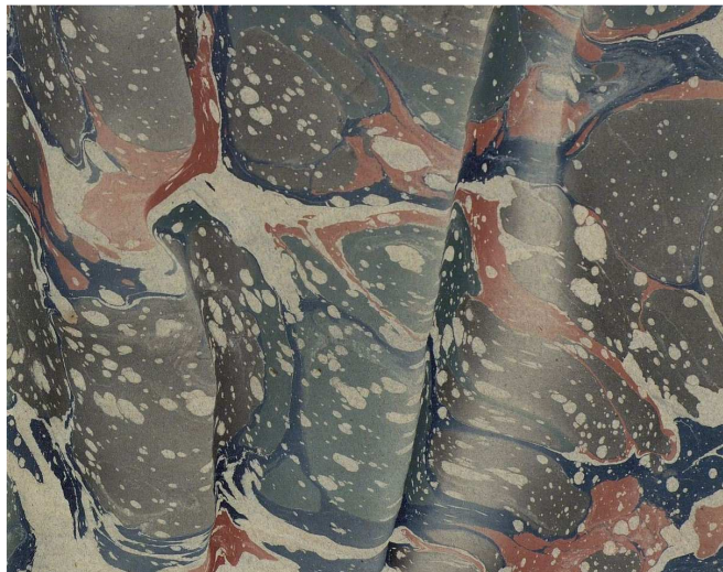
Papel marmorizado, século XIX, modelo Pregado Español. Garda do libro de asento de declaracións de consignatarios da aduana de Verín, ano 1844, Encadernación de D. Félix Manuel Rois. AHPOU, Delegación Provincial do Ministerio de Facenda en Ourense, libro 1134.

Nos papeis ao engrudo aplícase unha técnica na que se emprega este pegamento, composto por fariña ou amidón cocido, ao que se incorporan pigmentos para obter un tipo de pintura ou pasta coloreada que se aplica directamente sobre o papel ou cartón. Por esta razón tamén se denominan papeis empastados e caracterízanse pola obtención dunha cor con certa gradación tonal. O seu uso será externo, é dicir, funda-