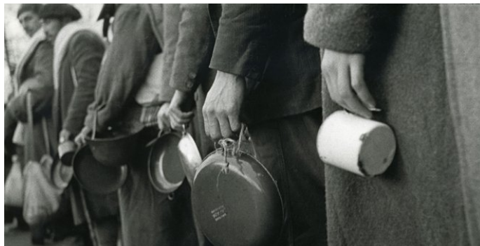
Milicianos haciendo fila para recibir la comida del almuerzo. Gijón 1937

CONSTANTINO SUAREZ , comenzó a realizar fotografías en su adolescencia, pasando a ser más tarde reportero gráfico en diarios nacionales y locales. Muy vinculado al Ateneo Obrero de Gijón, ciudad donde nació y capital de Asturias desde el 18 de julio de 1936 hasta finales de octubre de 1937. Simpatizó con la República y sus fotografías nos muestran, al igual que las de Florentino López, la vida cotidiana, la guerra y la supervivencia de en las dos ciudades asturianas, durante la Guerra Civil Española de 1936-1939.