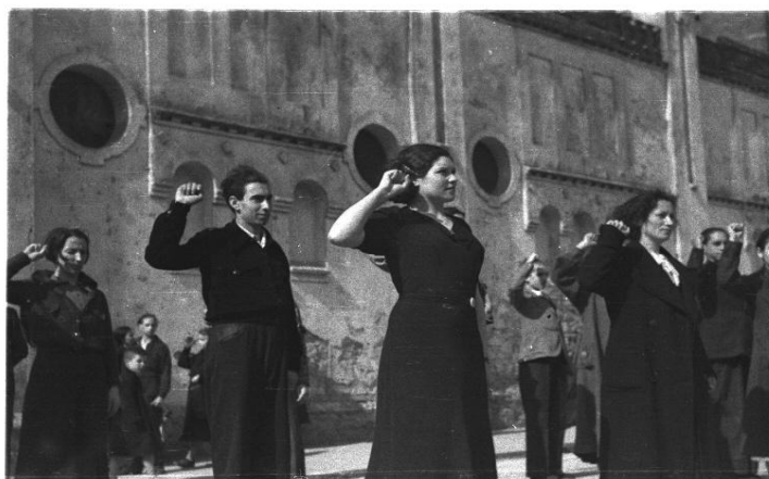
Miembros de la Juventudes Unificadas Socialistas Saludando. Gijón 1936

Todas las fotografías de esta exposición, un total de 115, 65 en papel y 50 que se proyectan en un audiovisual, así como algunos objetos personales como el maletín de trabajo de Floro y documentos de la época, pertenecen a la colección del Muséu del Pueblu d'Asturies, (Museo del Pueblo de Asturias). Las fotografías tomadas por dos fotógrafos que vivieron la Guerra Civil española de 1936-1939, en dos ciudades de bandos enfrentados y cada uno de ellos quiso retratar la vida y los momentos de una sociedad civil, atrapada en aquel conflicto bélico.