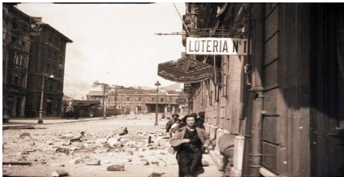
La calle Uría de Oviedo tras un bombardeo 1936