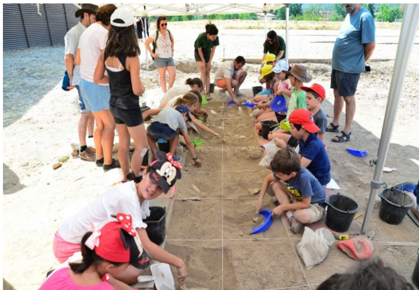
Imagen de ARQUEÓLOGOS POR UN DÍA, programa desarrollado por el Ayuntamiento de Alcalá de Henares.

En él más de 3.000 niñas y niños, de 8 a 14 años, aprenderán las labores de un arqueólogo en el yacimiento de Complutum del 2 de julio al 29 de septiembre.