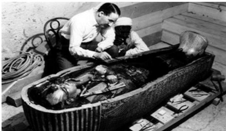
Howard Carter y un ayudante revisando el sarcófago de Tutankamon

El pasado 12 de julio el féretro fue transportado desde el Valle de los Reyes y la ciudad monumental de Luxor, en un recorrido de más de 500 kilómetros, escoltado por Fuerzas de Seguridad Egipcias, al Gran Museo Egipcio (GEM), donde el Ministro de Antigüedades de Egipto, Khaled El-Enany, declaró ante los periodistas: "Esperamos que en entre 8 y 9 meses de trabajo podamos conseguir un buen grado de preservación. Es un proyecto muy delicado porque como pueden ver el cofre es muy delicado" . Dijo el ministro de antigüedades.