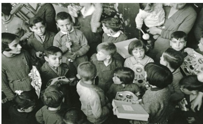
Niños recibiendo juguetes de Francia recibidos a través del Socorro Rojo Gijón 1936.