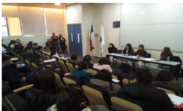
Un aspecto de la sala donde se celebró el Seminario