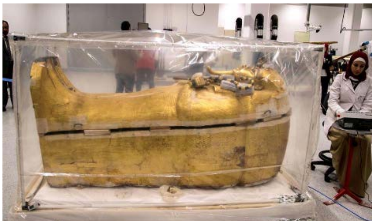
Una de las imágenes más distribuida por la prensa de todo el mundo, del proceso de restauración.

En el GEM , desde el día 17 del citado mes un nutrido grupo de restauradores, ha iniciado los pasos de la primera restauración a la que se somete el sarcófago desde su hallazgo en 1922. La primera etapa pasa por practicarle un proceso de fumigación de tres semanas y después seguirán con el resto del proceso. La idea es que el trabajo esté terminado para el momento en que abra el GEM, previsto para 2020, y que el féretro de madera dorado y el sarcófago exterior, puedan ser vistos juntos por primera vez.