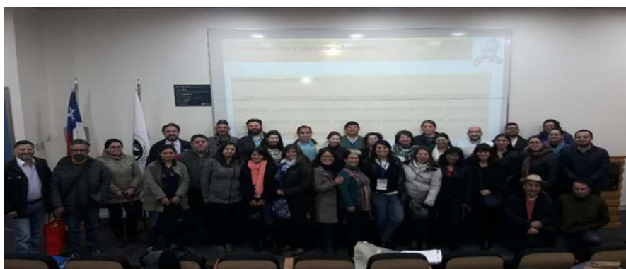
Grupo de participantes en el Seminario posando para la posteridad

Coordinadora del Archivo y del Centro de Investigación y Documentación Universidad Finis Terrae.