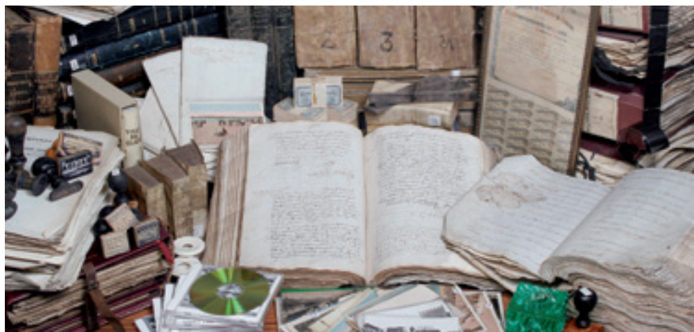
El archivo tiene una gran variedad de fondos, representada de forma simbólica en este bodegón.

A partir de esa fecha se ponen en marcha el Archivo Histórico (fondo municipal 1507-1960 y otros fondos históricos de interés local), el Archivo Central Administrativo (1961-2013), la Biblioteca, EL Archivo de Imágenes y la Hemeroteca además de otro servicio interno: Documentación (suscripciones, bases de datos y biblioteca técnica).