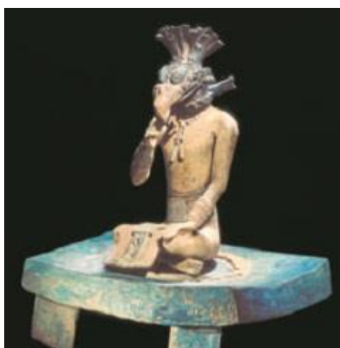
Figura policromada de un hombre pájaro.

La exposición recoge obras que van desde un milenio antes de Cristo , hasta la llegada de los conquistadores españoles a finales del siglo XV. Las investigaciones relacionadas con la exposición han permitido conocer más y mejor la expansión del conocimiento y los intercambios culturales que hubo entre las distintas civilizaciones de la América Precolombina. Por ejemplo, los metales comenzaron a llegar a la actual Centroamérica y el Norte de México como moneda de cambio y como consecuencia del interés de las civilizaciones andinas por encontrar el « spondylus », un molusco cuya concha de color rojo, era muy usada por los orfebres del sur y para algunos pueblos y sus culturas, tenía en más valor que el oro y otros metales nobles.