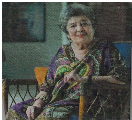
Claribel Alegria.

La escritora y poeta nicaragüense Claribel Alegria, falleció en su casa de Managua el pasado 25 de enero. Había sido galardonada con el Premio Iberoamericano de Poesía Reina Sofía, en el mes de noviembre de 2017.