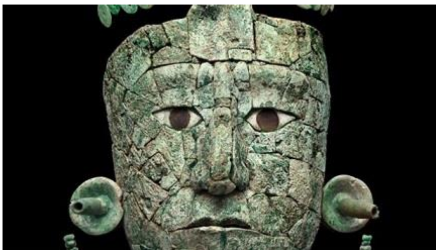
Máscara funeraria la Reina Roja.