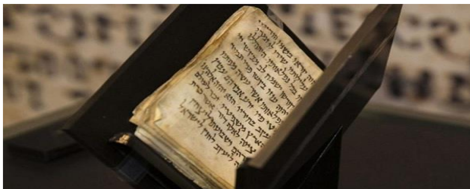
Imagen del Libro Sefardita comentado

Probablemente, este pequeño libro de oraciones formó parte del equipaje de alguna familia sefaradí que emigró de Polonia a México a principios del s. XX, y que encontró en este país un hogar, (como lo encontraron muchos españoles años después), para desarrollar y practicar libremente sus tradiciones y transmitir las a las siguientes generaciones.