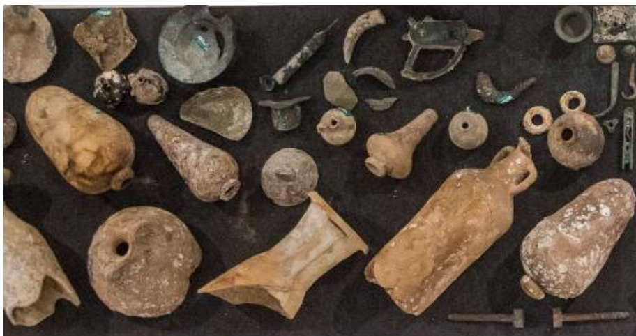
Algunos de los objetos rescatados por la Guardia Civil. J.C. Toro.

También dos encargados del yacimiento visigodo Casa del Obispo, en el centro de Cádiz, están siendo investigados como supuestos vendedores de las piezas. Además de haber extraído sin permiso alguno, una estela funeraria del siglo VI del espacio público que gestionaban.