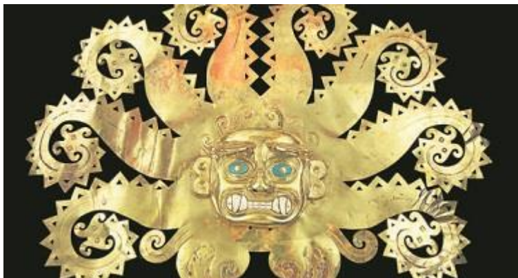
Adorno en forma de pulpo, Cultura Moche, Perú.

Conjuntos completos como el del Señor de Sipán , la tumba precolombina más rica, encontrada intacta, en el norte del Perú actual. con joyas en oro y turquesa de un rico noble de la civilización Moche, O la «Reina Roja» , una máscara funeraria de malaquita recuperada en los hallazgos arqueológicos de Palenque, en México.