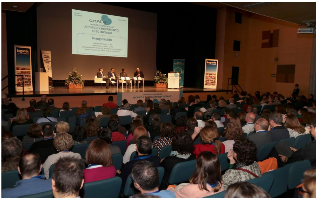
Aspecto general del Salón de Actos durante una de las sesiones.

Las tres administraciones: Central, Autonómica y Local han de adaptar sus sistemas de archivo y de gestión de los documentos a una nueva realidad. Conocer lo que hay que hacer, saber cómo hacerlo y buscar las mejores soluciones para cada caso , son los retos urgentes de los responsables políticos y técnicos de la Administración en General para cumplir con la normativa citada.