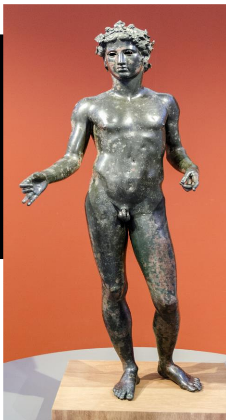
Imagen del Efebo de Antequera.