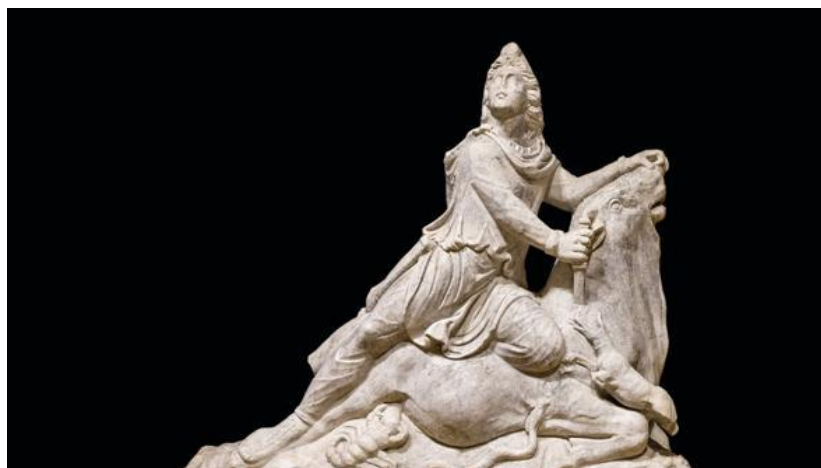
Imagen del dios Mitra Tauróctono.

A través de las 150 piezas o tesoros, la exposición va recorriendo la memoria material de España, desde la tabla de Osuna que recoge la Ley más antigua de nuestro país, el Mitra tauróctono o el ídolo de Tara que marcan las tres grandes etapas de la arqueología española. Con esta exposición se cierran los actos que han venido celebrándose en el Museo Arqueológico Nacional con motivo de sus 150 años.