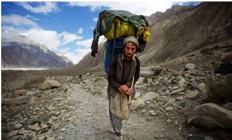
Fotograma del Documental "K2 and the invisible Footmen" de Lara Lee

Desde el pasado día 9 y hasta el día 20 del mes de enero, el MUSAC proyectará 20 documentales en la I Edición del Festival de Etnovideografía 2027 .