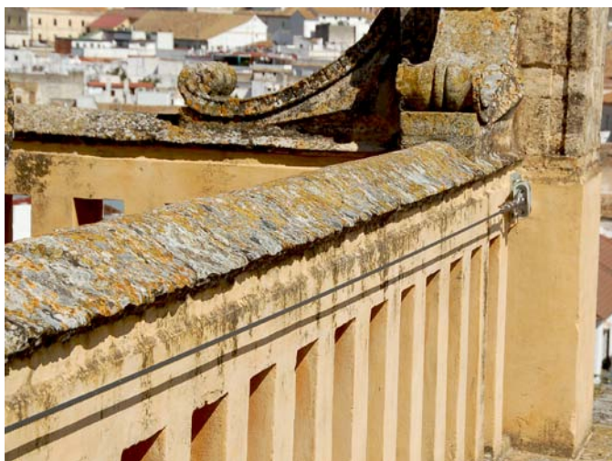
LÍNEA DE VIDA EN LAS CUBIERTAS DE LA MEZQUITA DE CÓRDOBA. MANTENIMIENTO DEL EDIFICIO

Una vez inscrito no se devolverá el importe de la matrícula.