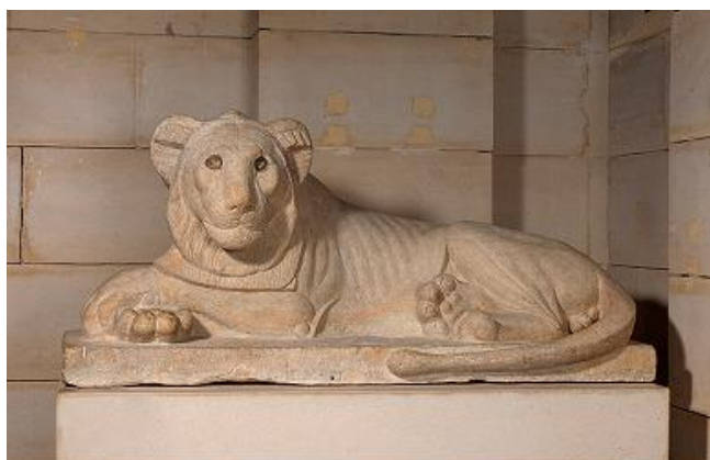
Estatua de león tumbado sobre un costado. Caliza. Baja Época, dinastía XXX, reinado de Nectanebo I (378-361 a. C.).

El Museo Arqueológico Regional acoge la exposición Dioses, héroes y atletas. La imagen del cuerpo en la Grecia antigua , que aborda el ideal de belleza en la antigua Grecia, aportando una novedosa visión sobre la manera en que la cultura occidental ha asimilado las antiguas representaciones de cuerpos desnudos y cómo estas han influido en el actual canon de belleza o fealdad. Casi un centenar de obras, la mayor parte procedentes de instituciones griegas y que salen por primera vez del país, fraguan un recorrido en el que destacan el 'Kouros' del santuario de Apolo Ptoios, un atleta o 'Kiniskos' de Policeto y una espléndida colección de cerámica que abarca desde el periodo geométrico a la técnica de las figuras rojas.