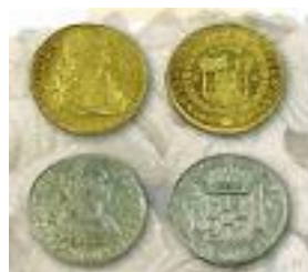
Maqueta de la fragata Nuestra Sr a de las Mercedes y muestra de monedas de oro y plata rescatadas